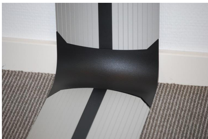
Verleng / kopelement / verticaal