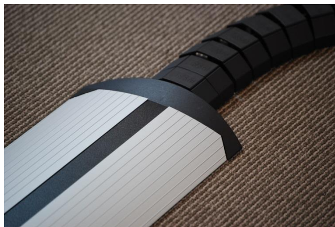
Eindstuk / overgang naar Flexkanaal