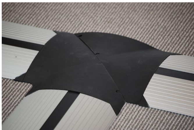
T-Stuk / splitter